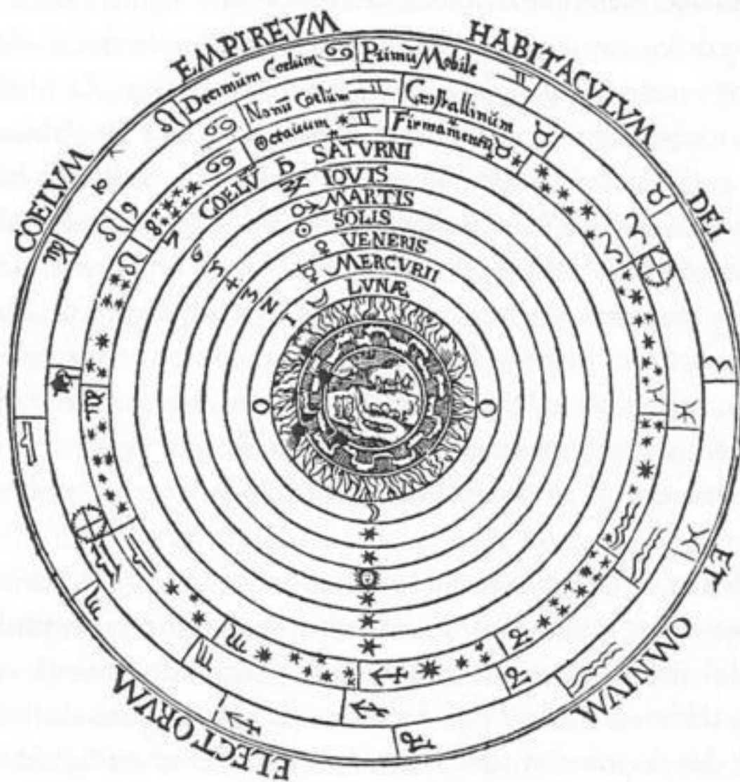
Det aristoteliske, geocentriske univers i den middelalderlig-kristne variant, her fra Petrus Apianus' Cosmographicum liber fra 1533.

De to verdensbilleder eleverne skal lave ude af naturmaterialer