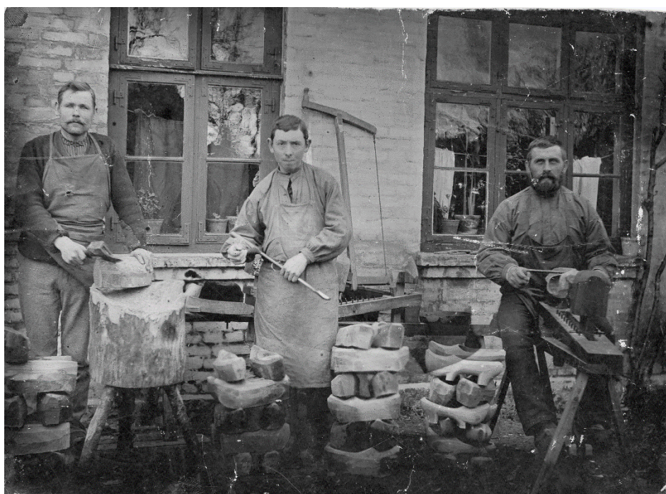
Ringsted træslibefabrik, begyndelsen af 1900-tallet.

Kort beskrivelse: Knofedt og maskinkraft er et dialogbaseret undervisningsforløb, som finder sted på Ringsted Museum og Ringsted Mølle. Forløbet tager et komparativt blik på børnearbejdernes vilkår på landet og i byen i Danmark i perioden 1850- 1920. Gennem levende fortælling og hands-on aktiviteter opfordres eleverne til at reflektere over vilkår for børnearbejdere i gamle dage og perspektivere deres viden i forhold til børnearbejdernes vilkår i andre lande i dag.