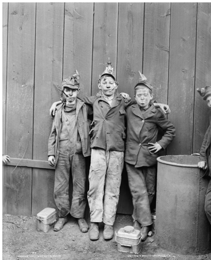
Arbejdsdrengene "Breaker Boys", Kingston, PA USA 1900-1910.

Kom i gang ved at tale om de nedenstående billeder sammen i klassen.