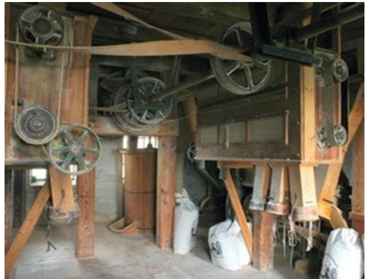
Ringsted Mølle