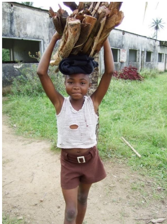
Børnearbejder i Madagaskar i vores tid.

Kom i gang ved at tale om de nedenstående billeder sammen i klassen.