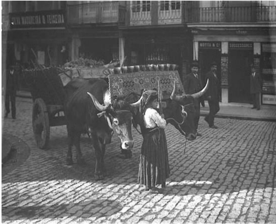
Pige med en kærre i Porto, Portugal.