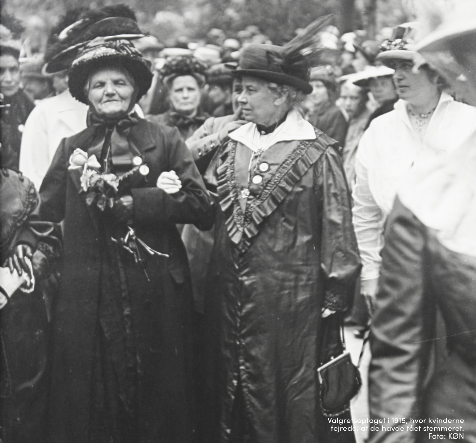
Valgretsoptøget i 1915, hvor kvinderne fejrede, at de havde fået stemmeret.